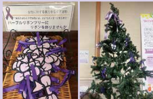
昨年の設置の様子

当館でも、期間中パープルツリーをエントランスに設置し、来館者の皆さんに飾りつけていただくリボンを用意いたします。