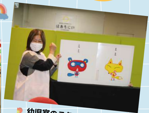
幼児室のスタッフが絵本や 紙芝居を読み聞かせ♪