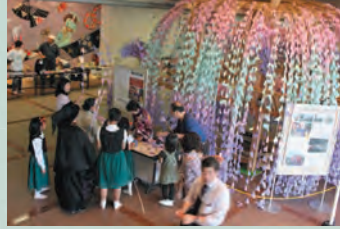
「こんにちは はあもいです」の会場でも、多くの方が御簾づくりに挑戦