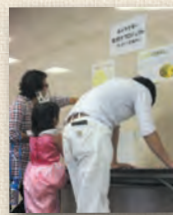
「こんにちは はあもいです」の日に、名前を募集しました！