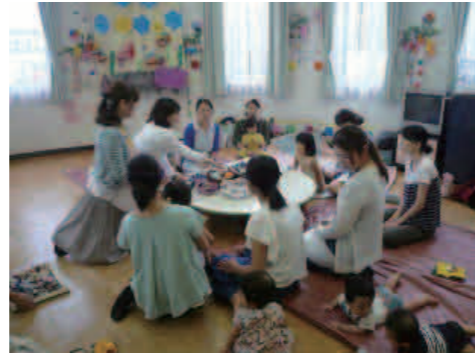
益城の避難所から遊びに来てくれる親子もいました

親子が避難所や家を離れ、ひとときでもリラックスできる場所としてご案内。市民団体の協力を受け、ベビーサイン教室や親子ふれあい会、シュシュ教室などミニイベントも開催しました。多い日には20を超える人が来館。地震後は子どもの遊び場所が壊れたり避難所になったりと使用できなくなり、保育園や幼稚園も休園、また、家の中にいると余震の恐怖があるなど、心が休まる場所が激減しました。利用された人からは「県外から引っ越してきたばかりで、頼れる人も行く場所もなく、とても助かりました」「家にいると片づけなどでゆううつになるが、ここだと子どもを思い切り遊ばせることができ、親もリフレッシュできました」など、子どもだけでなく、親のストレス解消にもなったという声が聞かれました。