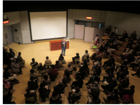
満員御礼の会場。参加の男女比はほぼ半々。飾り気の無い高橋さんの語り口に、会場はリラックスした空気に。

参加者からは「男の生き方は女性的であれというアドバイスを実践してみようと思った」「おしつけがましくない男性論や新しい発見もあって面白かった」「講師との距離も近く、話がよく伝わった」といった感想が寄せられました。