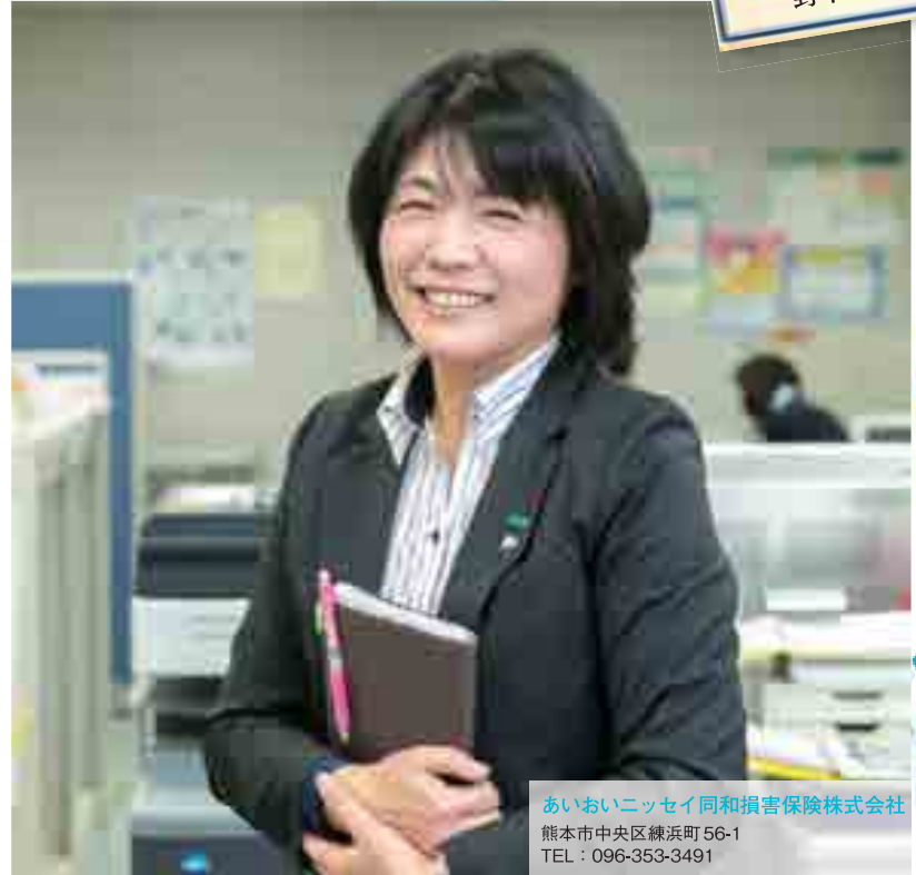
あいおいニッセイ同和損害保険株式会社 熊本市中央区練浜町56-1 TEL : 096-353-3491